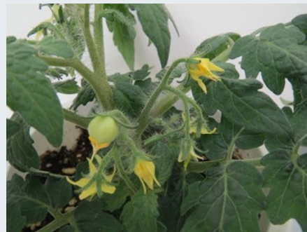
単為結果性トマト

DNAマーカーは、ある特定領域のDNAの塩基配列の違いを識別することにより、品種や個体を識別できるゲノム上の目印です。DNAマーカーを利用することにより、ある目的とする性質を有する個体を選抜したり、品種の系統解析を行うことができます。本講演では、講演者が研究対象としている「単為結果性」という性質を例に、DNAマーカーの開発方法と品種育成での利用例について紹介します。